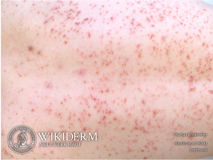
📍 Staphyloдерmie, Rücken