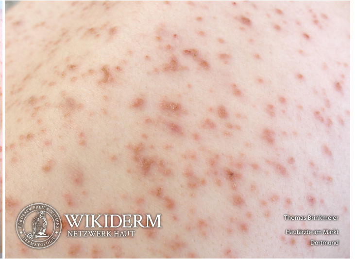
📍 Staphyloдерmie, Rücken, Nahansicht