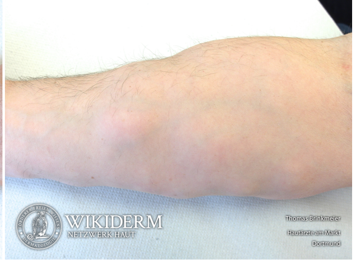
benigne symmetrische Lipomatose, Unterarm, Abb. 2