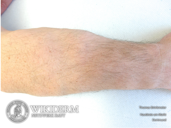
benigne symmetrische Lipomatose, Unterarm, Abb. 1