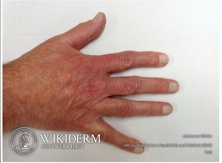
Leukonychie, Fingernägel, Abb. 2